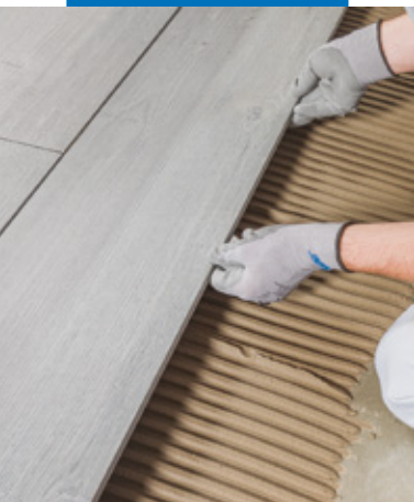
Verlegung von Keramik in Holzoptik auf einen mit Mapelastic abgedichteten Untergrund