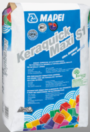
Keraquick Maxi S1 weiß - ultra weiß

Die Vervielfältigung der hier veröffentlichten Texte, Fotos und Illustrationen ist untersagt und bedarf der vorherigen Genehmigung durch MAPEI