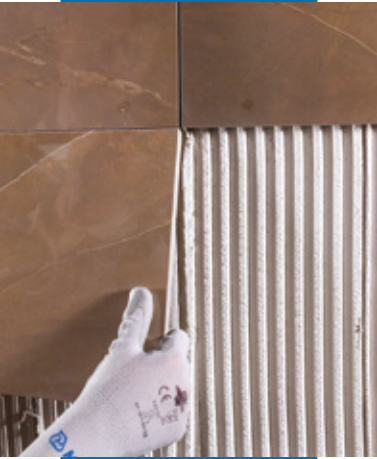
Ansetzen von Wandfliesen