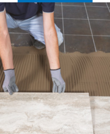
Verlegung von Stein-Effekt-Bodenfliesen auf einen Altbelag