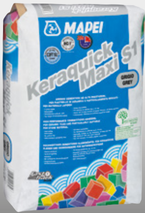
Keraquick Maxi S1 grau

Alle relevanten Referenzen zum Produkt sind auf Anfrage oder im Internet unter www.mapei.com erhältlich